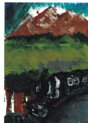
Amiezi cu mocăniță și cu libelule